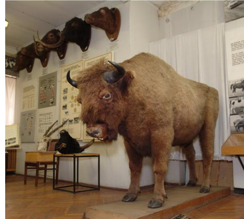
Музей животноводства имени Е.Ф. Лискуна