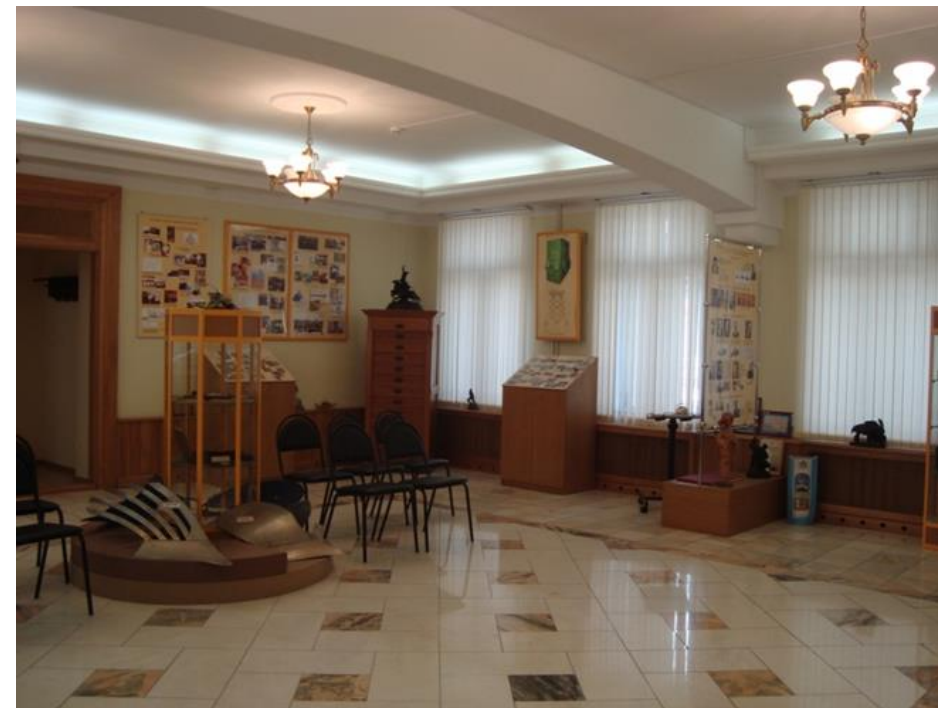
Музей агроинженерии и техники имени В.П. Горячкина