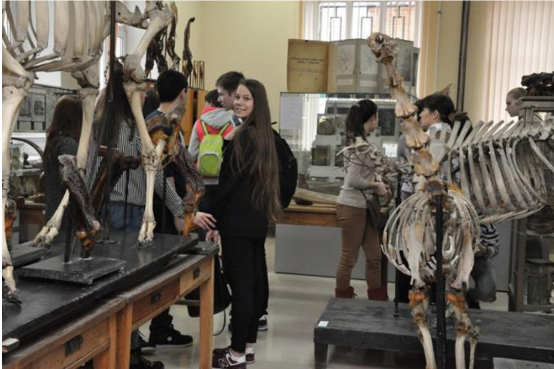
Музей Анатомии им. Б.К. Гиндце