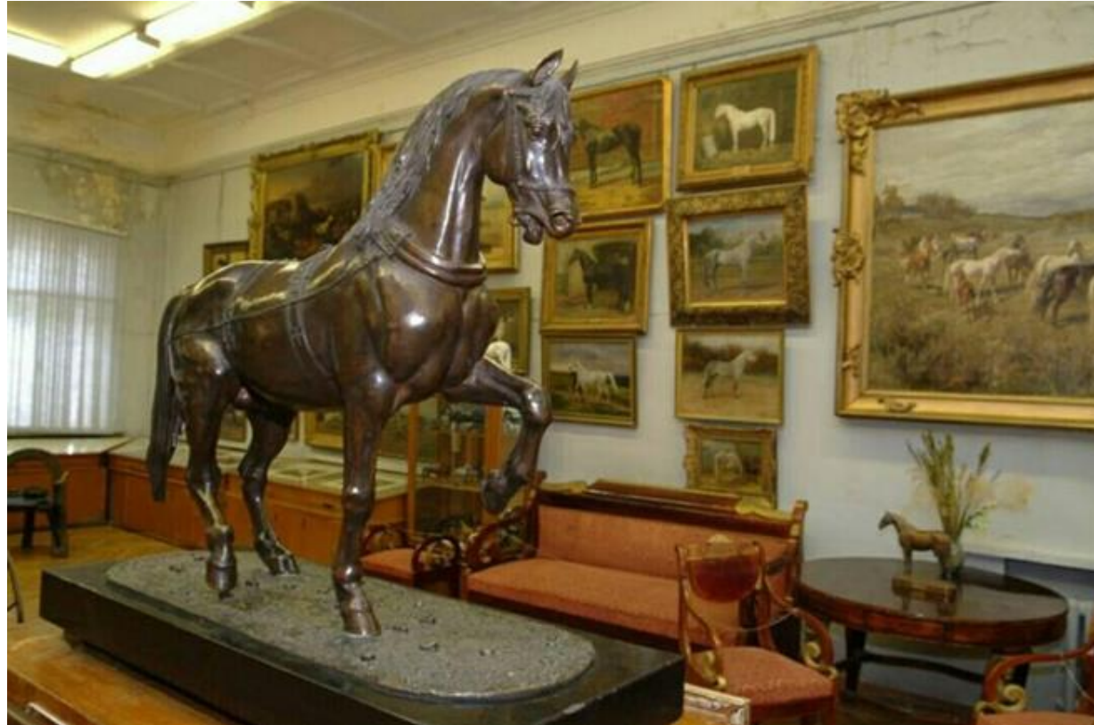
Научно-художественный музей коневодства