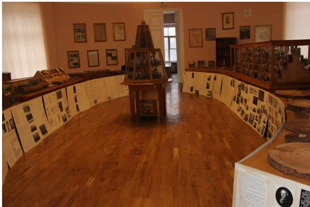
Музей леса им. А.Р. Варгаса де Бедемара