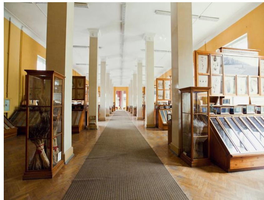
Почвенно-агрономический музей имени В.Р. Вильямса