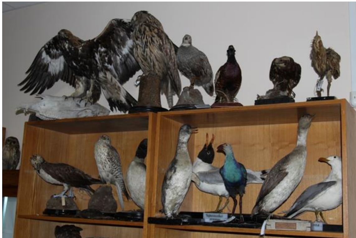
Зоологический музей имени Н.М. Кулагина