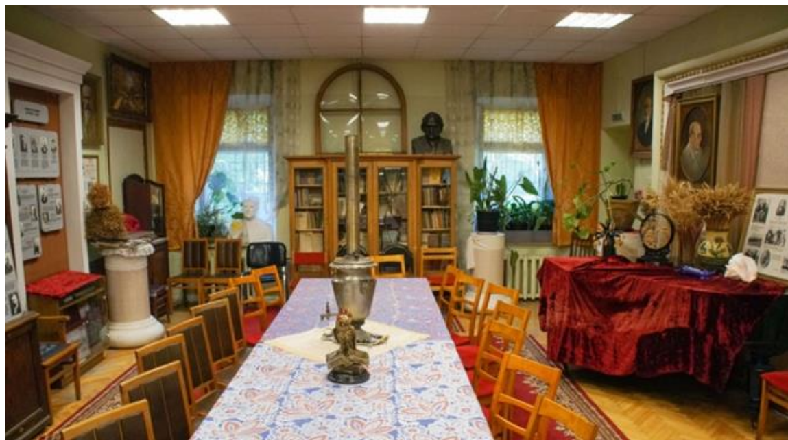
Музей истории МСХА