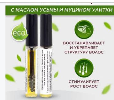
Масло для усиления роста бровей и ресниц с маслом усьмы и муцином улитки