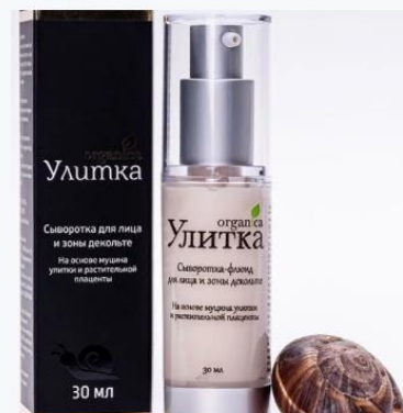
Крем дневной для лица и зоны