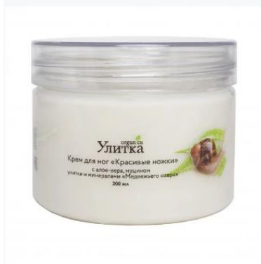
Крем для ног «Красивые ножки»