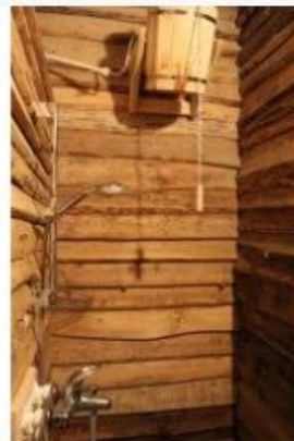
Баня "Сеновал" 2 200.00 ₽