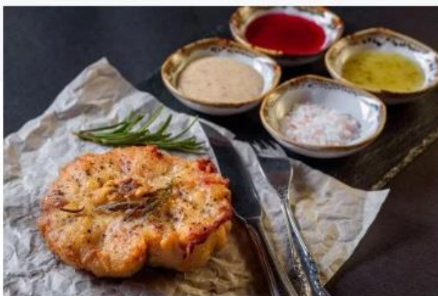
Стейк из крокодила (хвостовая часть)