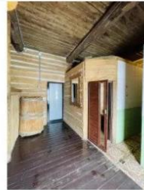
Березовая баня 1 600.00 ₽