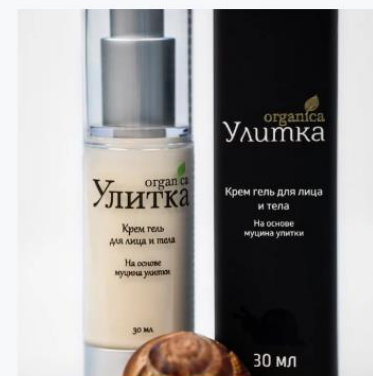
Крем гель для лица