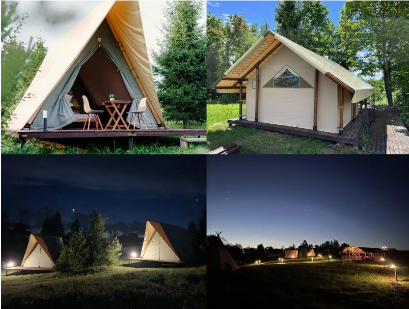
Аренда глэмпинга на Ферме «Российские Альпаки»

Аренда 1 двухместного глэмпинга (тип А): с пт/сб и сб/вс (+праздники) - 9.000₽ | с вс/пн/вт/ср/чт/пт - 7.000₽.