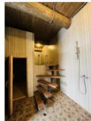
Баня "СССР" 5 200.00 ₽