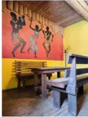
Баня "Африка" 1 200.00 ₽