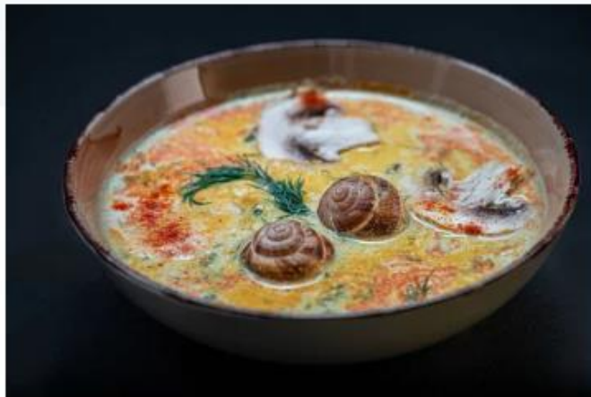
Том Ям с мясом улитки Muller