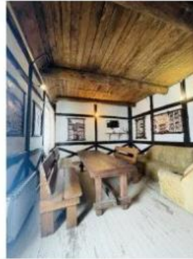
Баня "Бавария" 1 600.00 ₽