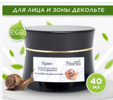
Крем ночной для лица и зоны декольте на основе муцина улитки