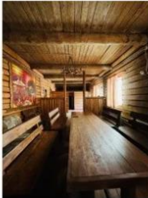
Красный барин 5 200.00 ₽