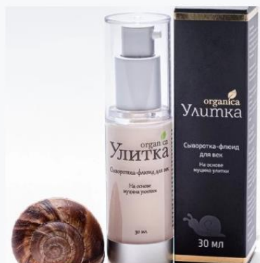
Сыворотка-флюид для век