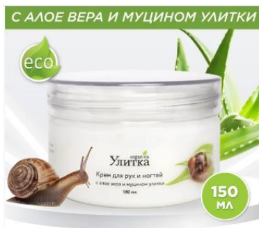
Крем для рук «Уход и сияние»