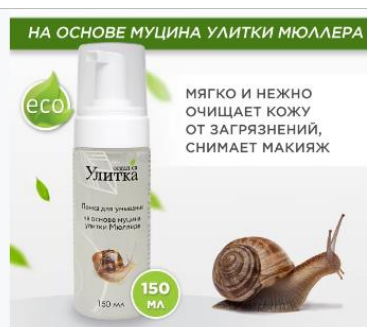
Пенка-мусс для умывания с муцином улитки 150 мл